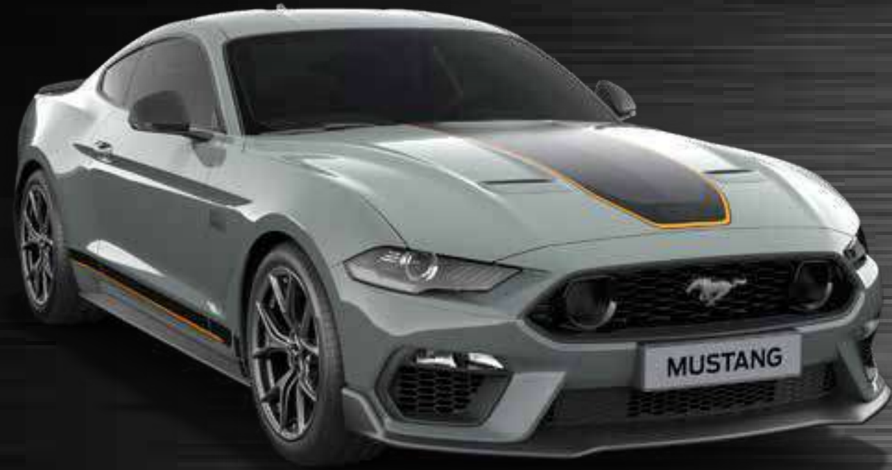
FIGHTER JET GRAY