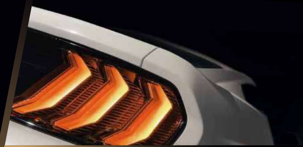
Faros traseros LED de tres barras

DIFERENTE DESDE CUALQUIER ÁNGULO, SUS ESCULTURALES LÍNEAS TRASERAS Y DETALLES CLÁSICOS DESTILAN EMOCIÓN.