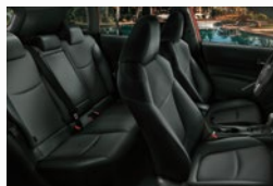
Asientos tapizados en cuero natural y ecológico (**)