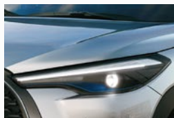
Faros delanteros Bi-LED con regulación en altura (*) (***)