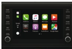
Pantalla táctil de 8" con Apple CarPlay® y Android Auto® (***)