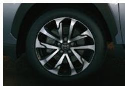
Llantas de aleación de 18" (**)