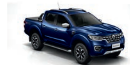
Azul Cosmos (RPR)