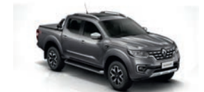
Gris Cuarzo (KNS)