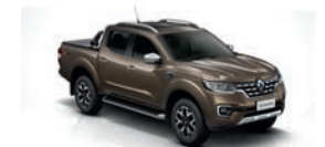
Marrón Visón (CNM)