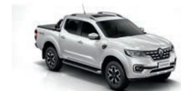
Blanco Glaciar (369)