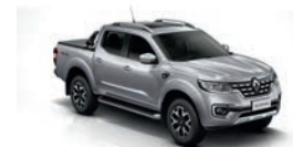
Gris Estrella (KNH)