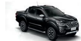
Negro Nacré (676)